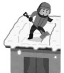
大雪消防組合当麻消防署